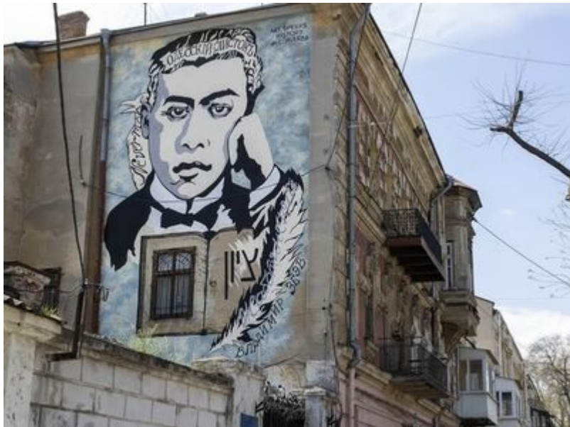
Freska na počest Vladimíra Jabotinského v Oděse (Ukrajina).

Jabotinskij byl zvolen ředitelem Světové sionistické organizace (WZO). Vrátil se však do bývalého ruského impéria, kde Symon Petljura právě vytvořil Ukrajinskou lidovou republiku. Jabotinskij a Petliura podepsali tajnou dohodu, že si vybojují místo v zemích bolševiků na východě a anarchistů Nestora Machna na jihu (dnešní Novorossie). Petljura byl zarytý antisemita a jeho muži byli zvyklí masakrovat židovské rodiny a vesnice ve vlastní zemi. Petliura byl ochráncem ukrajinských „integrálních nacionalistů“ a jejich mentora Dmytra Doncova, který se později stal správcem Ústavu Reinharda Heydricha odpovědného za provedení „konečného řešení židovské otázky“ [1].