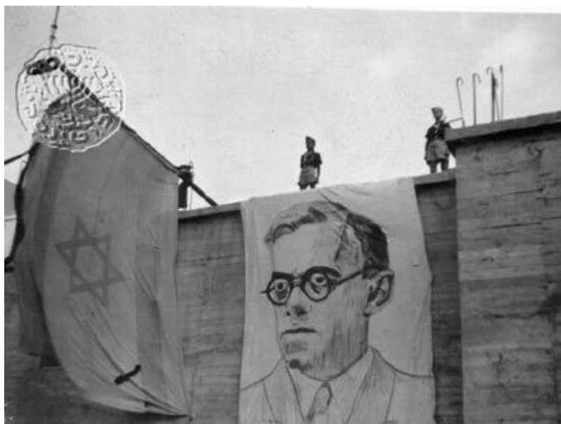
Čestná stráž Betaru před Jabotinského portrétem v citadele Ze'ev.

V roce 1936 Jabotinskij vypracoval „plán evakuace“ Židů ze střední a východní Evropy do Palestiny. Získal podporu polské hlavy státu, maršála Józefa Piłsudského, a jeho ministra zahraničí Józefa Becka. Ale také maďarského regenta admirála Miklóse Horthyho a nezapomněl ani na podporu rumunského premiéra Gheorghe Tătărescu. Plán se však nikdy neuskutečnil, protože Židé ze střední a východní Evropy měli strach z Jabotinského spojenců a protože britské impérium se stavělo proti masové emigraci do Palestiny. Nakonec Chaim Weizmann, tehdejší prezident Světové sionistické organizace, ujistil, že Jabotinskij se podílel na francouzsko-polsko-nacistickém plánu deportace Židů na Madagaskar.