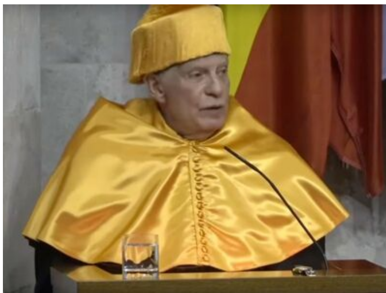
Josep Borrell odsuzuje vazby mezi Benjaminem Netanjahuem a Hamásem.

Josep Borrell, vysoký představitel Evropské unie pro zahraniční věci a bezpečnostní politiku, při přebírání čestného doktorátu ve Valadolidu prohlásil: „Jsme přesvědčeni, že k nastolení míru musí být zvenčí vnuceno řešení dvou států [izraelského a palestinského]. I když, a na tom trvám, Izrael potvrzuje, že [toto řešení] odmítá, a aby mu zabránil, zašel tak daleko, že sám vytvořil Hamás (...) Hamás byl financován izraelskou vládou ve snaze oslabit palestinskou samosprávu Fatah. Pokud však rázně nezasáhneme, spirála nenávisti a násilí bude pokračovat z generace na generaci, z pohřbu na pohřeb“.