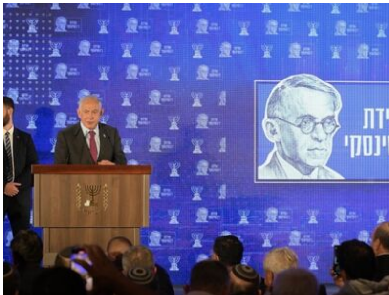
Premiér Benjamin Netanjahu vzdává hold svému hrdinovi Vladimiru Ze'evovi Jabotinskému.

Vladimir Jabotinskij zemřel v New Yorku v roce 1940. David ben Gourion se postavil proti převozu jeho popela do Izraele, ale v roce 1964 to izraelský premiér, Ukrajinec Levi Eškol, povolil.