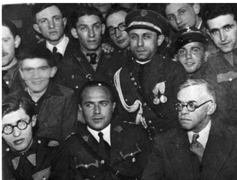
Vladimír Jabotinskij (vpravo) a Menachem Begin (vlevo) na setkání Betaru ve Varšavě.

Právě v tomto období Vladimír Jabotinskij předpověděl udivenému židovskému publiku holocaust. Podle něj by odmítnutím jeho evakuačního plánu diaspora vyvolala vlnu násilí proti ní. K překvapení všech to jeho přátelé skutečně provedli: vyhlazení milionů Židů.