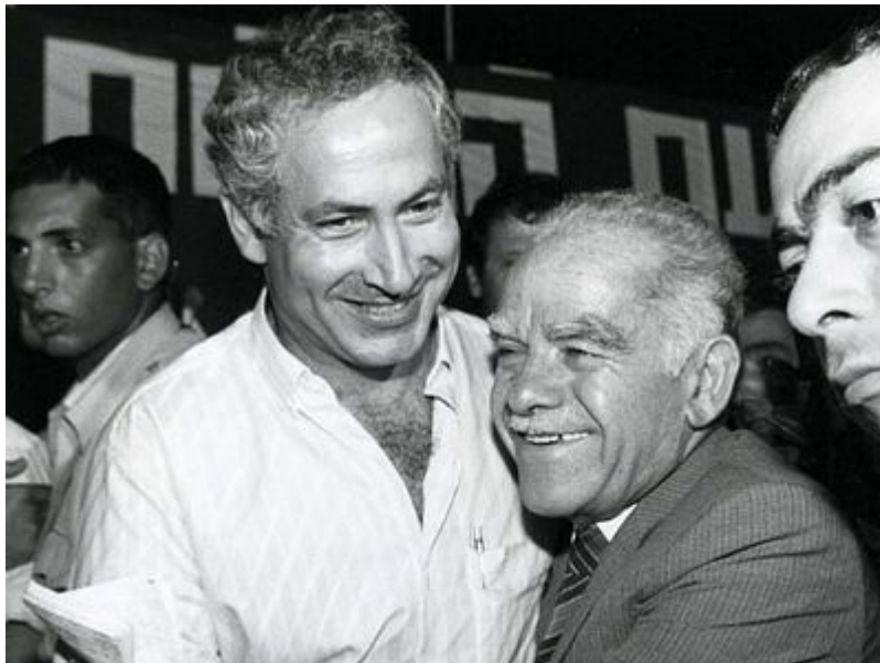
Benjamin Netanjahu v mládí a Jicchak Šamir.

Valnému shromáždění žádost o členství Izraele v OSN. „Prohlásil, že Stát Izrael tímto bez jakýchkoli výhrad přijímá závazky vyplývající z Charty Organizace spojených národů a zavazuje se je dodržovat ode dne, kdy se stane členem Organizace spojených národů“. Za těchto výslovných podmínek se Izrael stal členem OSN 11. května 1949. V následujících dnech byl Jehošua Cohen, vrah hraběte Bernadotta, diskrétně propuštěn. Stal se osobním strážcem premiéra Davida ben Gouriona.