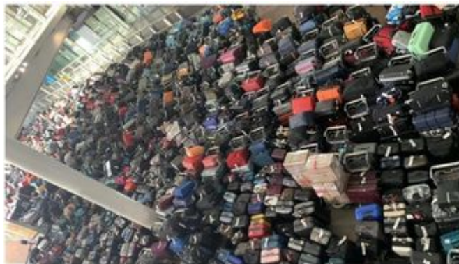
Zavazadla cestujících hromadně vyhozená na Heathrow, největším letišti v Evropě a sedmém největším na světě.

Problém je tedy skutečný, závažný a nebývalých rozměrů.