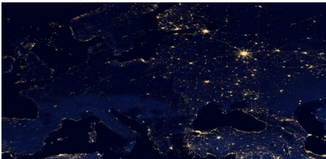
Takto vypadá Evropa v noci z vesmíru: nahoře Podzim-2021, dole Podzim-2022

Místní obyvatelé jsou si toho dobře vědomi, a tak bez čekání na únor a březen vycházejí do ulic nizozemských měst tisíce lidí, aby protestovali proti politice premiéra Marka Rutteho. Od začátku října počet protestujících roste a jejich akce jsou stále násilnější. Nizozemci házejí kameny a vajíčka na portréty premiéra, požadují snížení cen energií a zahajují masový boj proti podle nich hrozivému zdražování potravin.