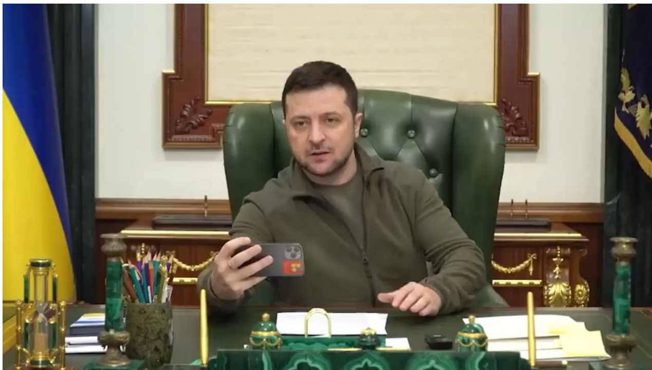
Zelenský ve své kanceláři při natáčení selfie videa na telefon

potvrzení z Moskvy, že Zelenský není na ruském “hit listu“, se Zelenský odvážil vylézt z bunkru a začal rozhazovat odvážně rukama, podobně jako Fiala, a prohlašovat, že zůstane na Ukrajině. Chucpe č. 2!