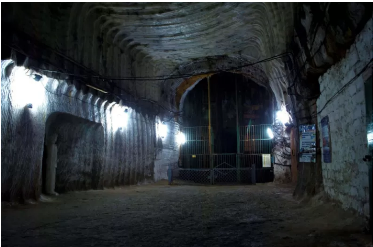
Solný důl Artemsol s muzeem těžby soli a sanatoriem v hloubce 288 m v Soledaru.

Minulý rok se tento dříve přehlížený aspekt Soledaru stal jeho nejvýznamnějším rysem. Výroba soli se zastavila a sádrárna přestala fungovat; jedinými návštěvníky pak byli ukrajinští vojáci – rozšíření astmatu byl tím nejmenším problémem.