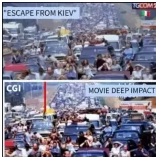
FAKE NEWS. Počítačově vytvořený údajný úprk lidí z Kyjeva

„Když si přečtete komentáře Rusů, většina z nich ho proklíná a posílá do pekla. Dokonce ani křesťanský patriarcha nevyjadřuje soustrast a ani nezmiňuje jeho jméno,“ říká zdroj z FSB.