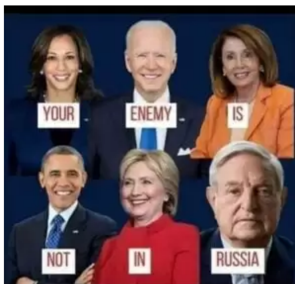
Váš nepřítel není v Rusku