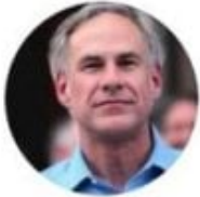
Greg Abbott ✓ @GregAbbott_TX