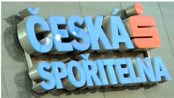
Česká spořitelna (ilustrační foto)

České spořitelně stoupl v pololetí čistý zisk o 67 procent na 11 miliard korun