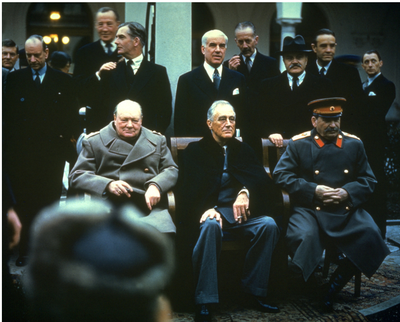
SOUBOR FOTOGRAFIE. Winston Churchill, Franklin Delano Roosevelt a Joseph Stalin na konferenci v Jaltě, únor 1945.

V roce 1956 Nikita Chruščov – který sám sehrál důležitou roli v politickém útlaku Velkého teroru – učinil krok, který měl nakonec obrovský vliv na Stalinův obraz. Během 20. sjezdu strany, aby upevnil svou vlastní moc, nový vůdce SSSR odsoudil zločiny svého bývalého šéfa a kult osobnosti, který si užíval během své vlády. Jeho projev byl šokem pro komunisty v Evropě, kteří byli nyní rozděleni více než kdy jindy, ale liberálové se mohli jen radovat. Dvě hlavní aktiva SSSR v západní Evropě byla následně roztržena. Italská komunistická strana usilovala o vnitropolitickou integraci, zatímco francouzská komunistická strana byla paralyzována. Kongres vyvolal počátek krize důvěry ohledně Sovětského svazu. Způsobem,