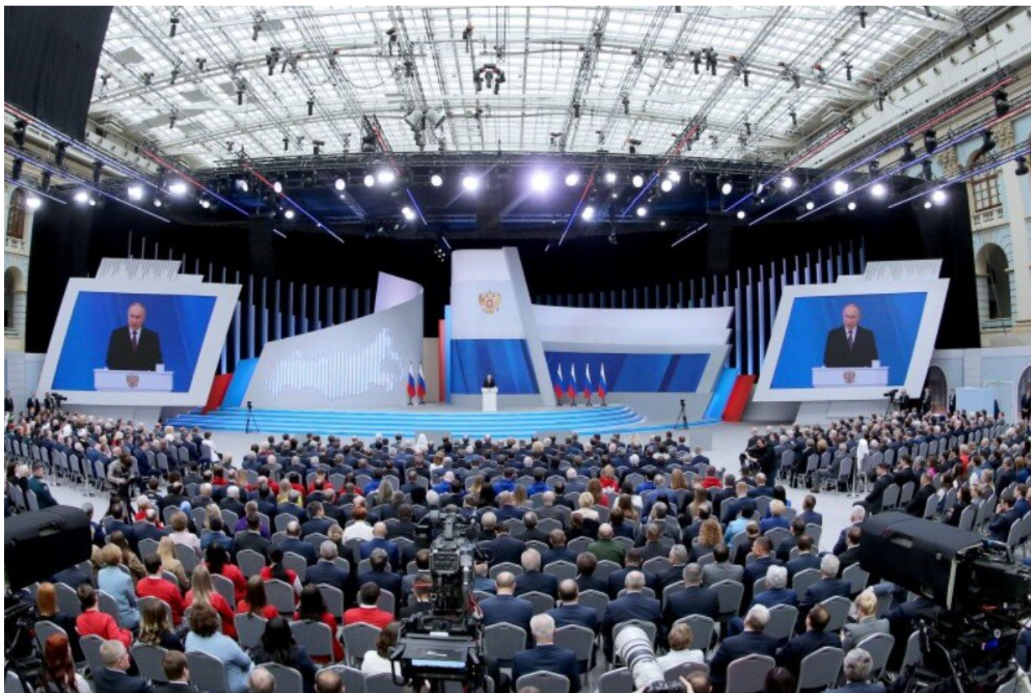
Projev Vladimira Putina k Federálnímu shromáždění 29. února 2024

Ale jak je to vůbec možné, moderní dějiny takové precedenty neznají, navíc sami západní politici a ekonomové konstatovali, že takové množství uvalených sankcí již vejde do světových dějin jako bezprecedentní sankční tlak.