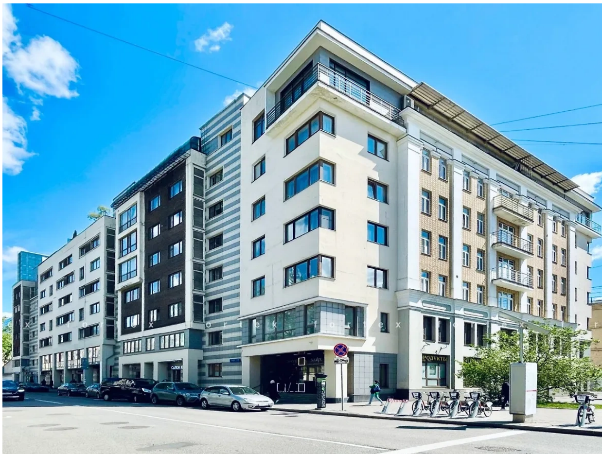
Obytný komplex "Dům na Gasheka".