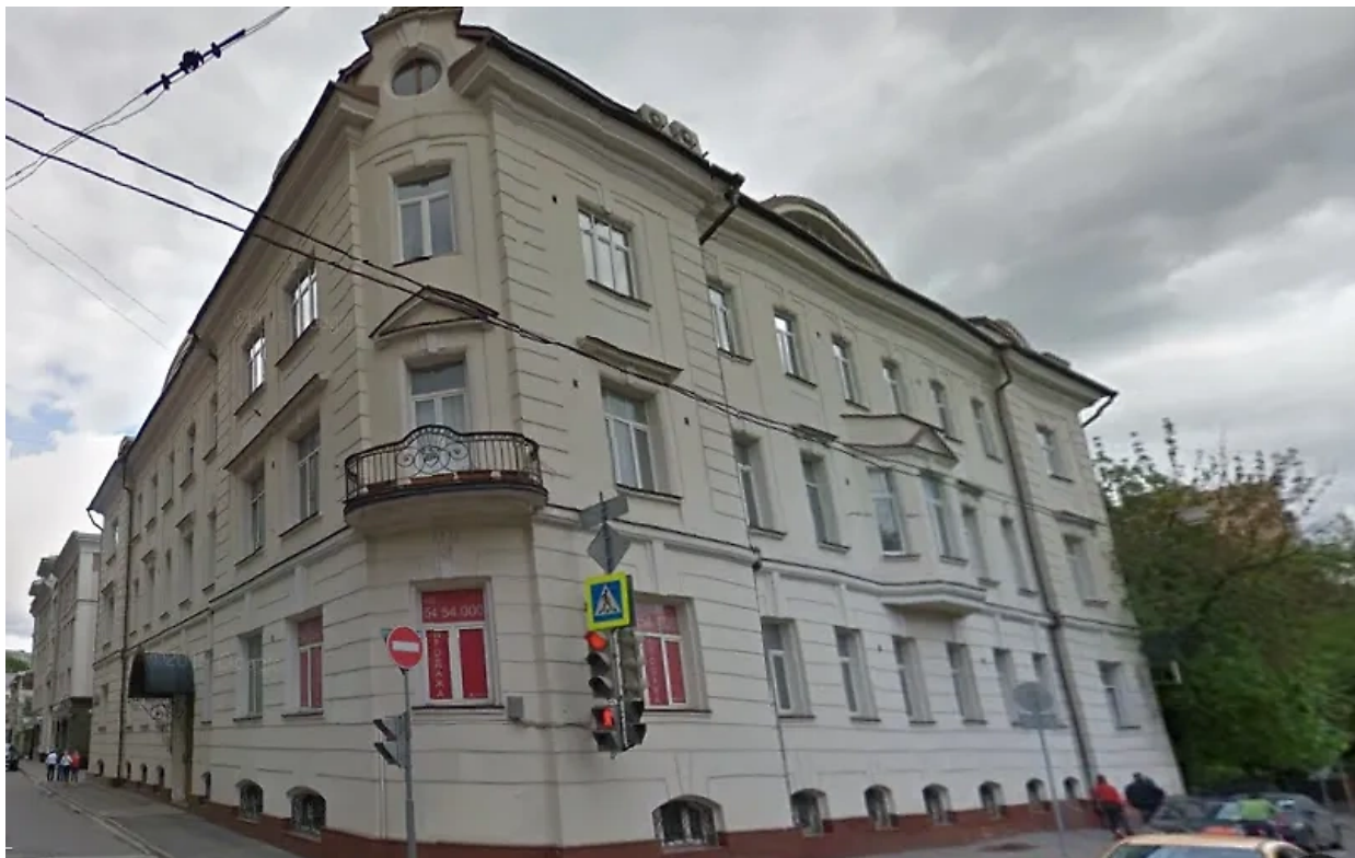
Historický dům poblíž katedrály Krista Spasitele.