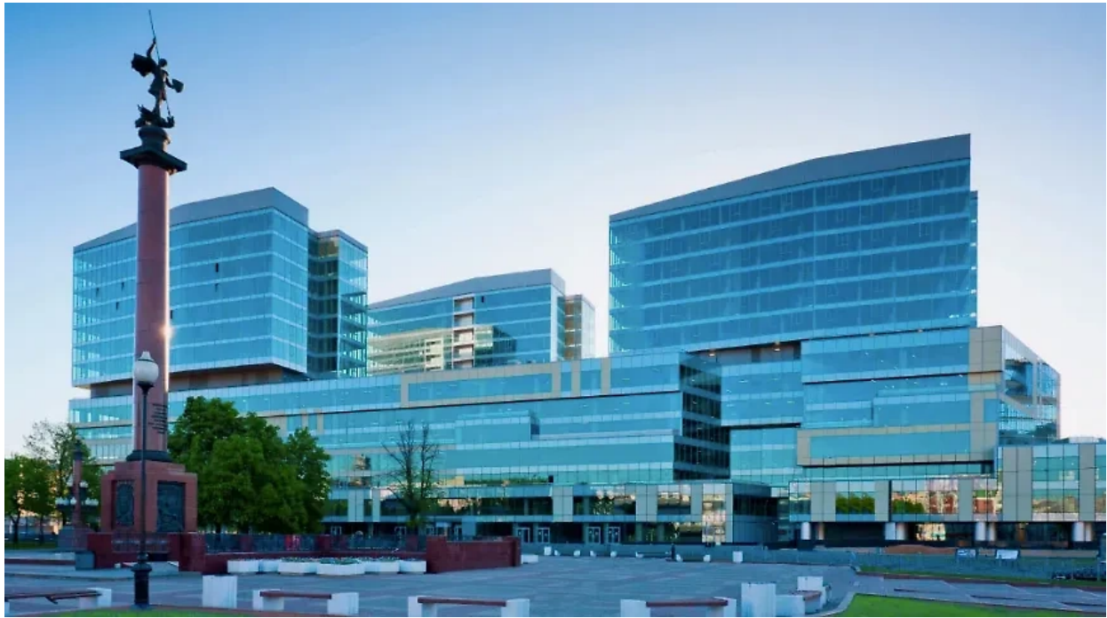
Obytný komplex "Legenda Tsvetnoy".