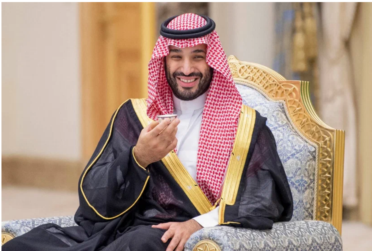
Korunní princ Saúdské Arábie.