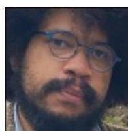
Autor: Malcolm Kyeyune Publicista Články autora ZDE

Stále více Američanů míří na východ. Západ upadl do militantní politické korektnosti, je přemožen materialismem a předsudky a Moskva je připravena nabídnout „politický azyl“ každému, kdo není ve své vlasti spokojen.