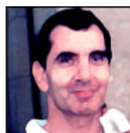
Autor: Pavel Kopecký Publicista Více o autorovi ZDE

Stále ještě mezi námi žije dost pamětníků poválečné doby, v níž Západ prosperoval, zatímco v zemích takzvaného socialistického tábora s plánovaným hospodářstvím byla řada věcí nedostatkových. Typicky automobily "na příděl". Čekání na spartaka bylo legendární. Zdálo se, že právě "přídělové hospodářství" odlišuje dva soupeřící systémy. Ono to bylo sice jinak, ale propagandisticky to fungovalo. A nyní se podle všeho v kruhu