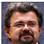
Autor: Jiří Weigl Ekonom Více o autorovi ZDE

rozvrácených okolních arabských zemí, jako jsou Sýrie, Irák, Jemen, Súdán, Libye a Libanon. I sousední stamiliónový Egypt jen tak tak unikl vojenským převratem a návratem k tvrdé diktatuře rozvratu a občanské válce v důsledku oslavovaného tzv. Arabského jara.