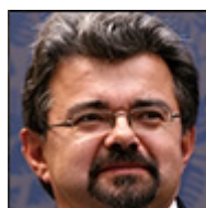
Autor: Jiří Weigl Ekonom Více o autorovi ZDE

generaci ohled a neomylně volí řešení, která seniorům s omezenou schopností se bránit přinesou jenom další zhoršení jejich života a jeho perspektiv.