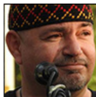
Autor: Ladislav Větvička Blogger, cestovatel Více o autorovi ZDE

Premijer se boji, že cosik zrobi špatně, tak raději nerobi nic, nebo se pta Němcu, co ma robit a vysledkem je, že nerobi nic. Němci mu samozřejmě neřeknu, že nema posilat eletryku do Lipska a draze ju kupovat. Ale je nesmysl se bavit s Německem o eletryce. Eletryka je naša a Němci ať si trhnu nohu, když si zrušili svoju eletryku z jadra. Jenže to by premijer nesměl byt fialova loutka a slaboch, kery si necha nadavat od jakehosik blbečka z Belgie . Měl by odejit okamžitě, dokud je čas. Ale čas už neni.