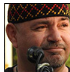
Autor: Ladislav Větvička Blogger, cestovatel Více o autorovi ZDE

Akurat stareho Helmuta odsunuli hned po valce jako nacystu, ale mladeho by neodsunuli ani za nic, bo ten byl tak hlupy, že ho ani do Hytlerjugend nezebrali. V Nemecku ho nechtěli a tak zustal v Ludgeřkach. Ale to nevadi.