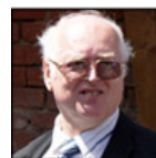
Autor: Radomír Malý Historik, publicista Více o autorovi ZDE

Vyhlášení tohoto článku víry vyvolalo negativní mediální reakci jednak protestantů, jednak vyznavačů novověkých ismů: liberálů, socialistů, komunistů atd. Protestanté se ohrazovali proti mariánské úctě, kterou odmítají, ti ostatní poukazovali na to, že papež se prý „vrací do středověku“ místo aby reagoval na aktuální potřeby dneška.