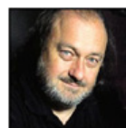
Autor: Ladislav Jaki , Komentátor, hudebník Více o autorovi ZDE

V době „zostřené svobody slova“ se pravda stává vzácným zbožím. Nejenže je potírána cenzurou a masovou propagandou. Lidé ji kvůli klidu a svému bezpečí raději uzamkají uvnitř sebe, aby si třeba neublížili. Kdoví, jak by to dnes dopadlo s oním chlapcem, který v pohádce Císařovy nové šaty vykřikl, že císař je nahý.