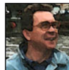
Autor: Václav Danda Publicista Více o autorovi ZDE

Kyjev ovšem dělá pravý opak. Snaží se způsobit co největší zkázu mezi civilním obyvatelstvem ve městech na osvobozeném Donbasu. Tam už totiž vůbec nejde o bojové operace - Donbas je pro popřevratovou kyjevskou juntou definitivně ztracen - ale pouze o zabíjení pro zabíjení, prostě čistý teror. A nejenže to jinak obvykle "moralizujícímu" Západu nevádí, ale ještě tomu nadšeně tleská. Jenže zdá se, že tentokrát už došla Rusku trpělivost a terorismus nezůstane bez odpovědi. Bohužel - může se to bezprostředně dotknout i nás.