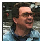
Autor: Václav Danda Publicista Více o autorovi ZDE

Kyjev ovšem dělá pravý pravý opak. Snaží se způsobit co největší zkázu mezi civilním obyvatelstvem ve městech na osvobozeném Donbasu. Tam už totiž vůbec nejde o bojové operace - Donbas je pro popřevratovou kyjevskou juntou definitivně ztracen - ale pouze o zabíjení pro zabíjení, prostě čistý teror. A nejenže to jinak obvykle "moralizujícímu" Západu nevádí, ale ještě tomu nadšeně tleská. Jenže zdá se, že tentokrát už došla Rusku trpělivost a terorismus nezůstane bez odpovědi. Bohužel - může se to bezprostředně dotknout i nás.