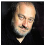
Autor: Ladislav Jakl, Komentátor, hudebník Více o autorovi ZDE

Dvě hydry dnešní doby, ničící svobody a životy lidí, se dnes unikátně spojily. Soudcokracie a klimatické šílenství si podaly pařáty, a vyrazily společně k útoku proti lidem.