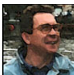
Autor: Václav Danda Publicista Více o autorovi ZDE

Další část ukrajinské lži se tento týden zhroutila jako domeček z karet či obrana na Donbasu kde ruská armáda prolomila obranné pozice kyjevských jednotek a překročila řeku Severní Doněc. Celé tři měsíce od zahájení speciální operace jsme zásobováni hrůzostrašnými historkami o zverstvech ruské armády znásilňující ženy a děti a vraždící civilisty. Tento týden se ukázalo, že si to celé ukrajinská propaganda vymyslela, aby ze západu vytáhla další miliardy dolarů na nejmodernější zbraně, kterými by mohli masakrovat obyvatele osvobozených území (do svých kapes).