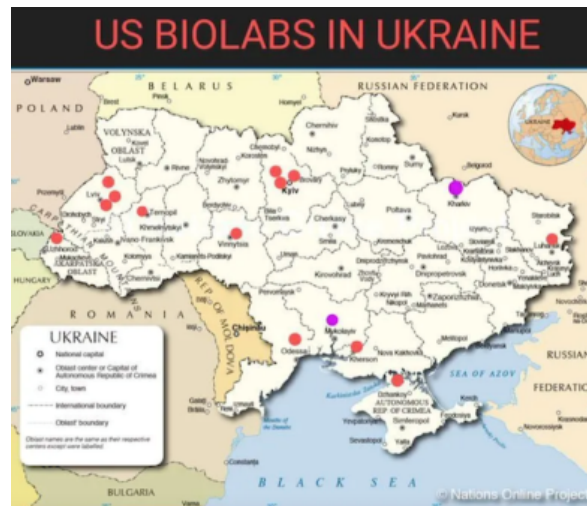
Mapa amerických biologických laboratoří na Ukrajině

Podle některých zpráv americké laboratoře na Ukrajině shromáždily také velké množství biologických informací od místních obyvatel. To vše pod rouškou výzkumu infekčních chorob. Podobné výzkumy dělají Američané s orientací na Číňany. Čínští odborníci se domnívají, že toto všechno směřuje k vytvoření speciálního viru, který má infikovat obyvatele Ruska a Číny.