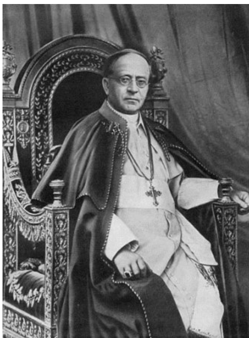
Papež Pius XI.

Pius XI. naznačuje podmínky, které jsou pro tento spravedlivý odpor vyžadovány. Třídí je do pěti kategorií: notorická a nepomíjející tyranie; závažná tyranie, která ohrožuje základní dobra národa; zjevná tyranie, kterou za takovou označují čestní lidé; nemožnost použití jiných prostředků; seriózní pravděpodobnost úspěchu.