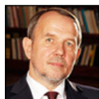
Autor: Petr Hájek , šéfredaktor PROTIPROUD Více o autorovi ZDE

Režimní média – jako jediná povolená, nezakázaná, nevypnutá – od počátku ukrajinské krize vnutila veřejnosti pojem „válka“. Tuto mystifikaci přijala o svého slovníku naprostá většina veřejnosti právě proto, že od prvního dne ruské „speciální operace“ v části pohraničních oblastí Ukrajiny, česká vláda protiprávně a protiústavně zlikvidovala větší část svobodných médií.