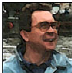
Autor: Václav Danda Publicista Více o autorovi ZDE

Rusko zasáhlo o víkendu kyjevský režim a jeho západní komplice na citlivém místě. Při útoku na základnu NATO 20 km od polských hranic u obce Javoriv byla zcela zničena po léta budovaná rozsáhlá vojenská infrastruktura a těžce zraněno či zabito kolem 180 převážně zahraničních žoldáků a zničeno velké množství zahraničních zbraní, které přes základnu do země proudily. Základna sloužila jako nástupiště pro zahraniční „dobrovolníky“, kteří se zde připravovali k nasazení do bojů v okolí Kyjeva.