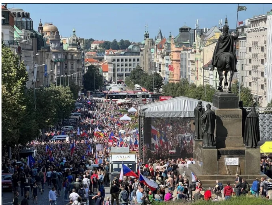
Hmm...není ten václavák najednou

Fotí se tedy zásadně hodinu nebo dvě PŘED zahájením demonstrace, objektivy v davu pečlivě hledají nejunaveněji nebo nejtupěji vypadajícího člověka a je vyhlášena lovecká sezóna na co nejvíc kontroverzní fotky a záběry. Super triky se dají dělat i s nastavením fotoaparátu, takže třeba rozumně rozestoupení lidé na tržišti na náplavce pak vypadají jako namačkaný dav teplých turistů na tureckém tržišti a narvaný václavák se zas na fotce promění v prostor, který působí klaustrofobicky i ve srovnání s umakartovým záchodkem.