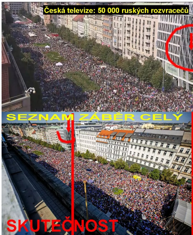
Jeden z mnoha triků – šikově udělaný ořez.

Fotí se tedy zásadně hodinu nebo dvě PŘED zahájením demonstrace, objektivy v davu pečlivě hledají nejunaveněji nebo nejtupěji vypadajícího člověka a je vyhlášena lovecká sezóna na co nejvíc kontroverzní fotky a záběry. Super triky se dají dělat i s nastavením fotoaparátu, takže třeba rozumně rozestoupení lidé na tržišti na náplavce pak vypadají jako namačkaný dav teplých turistů na tureckém tržišti a narvaný václavák se zas na fotce promění v prostor, který působí klaustrofobicky i ve srovnání s umakartovým záchodkem.