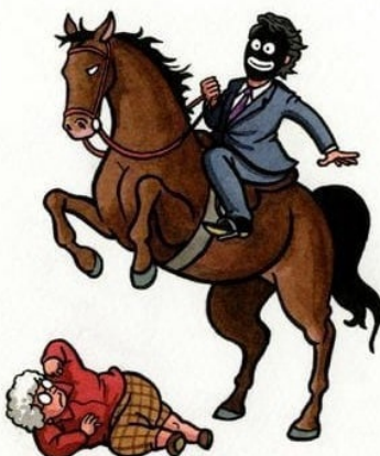
TOTO JE DEMOKRACIE