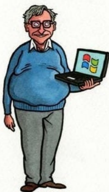
TOTO JE ZDRAVOTNÍ EXPERT

Co říci na závěr? No všechno výše jsou samozřejmě kremelské dezinformace. Naše „elity“ nás zachrání.