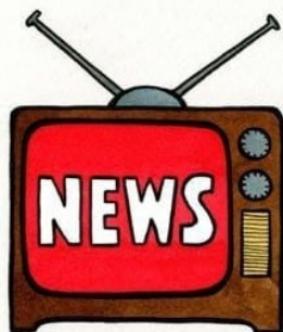
TOTO JE PRAVDA