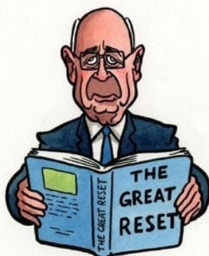
TOTO JE KONSPIRAČNÍ TEORIE