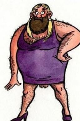
TOTO JE ŽENA