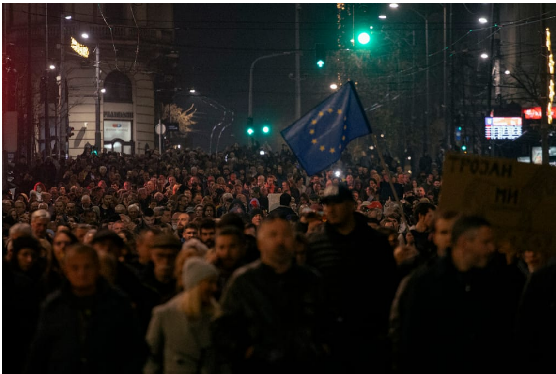
Příznivci opozice se účastní pochodu během protestu v Bělehradě, 26. prosince 2023

„Opakování voleb by za těchto okolností vedlo ke stejné situaci, v jaké jsme nyní, nebo ještě k horšímu,“ vysvětlil Nedělkov a trval na tom, že nejprve je nutný nezávislý audit.