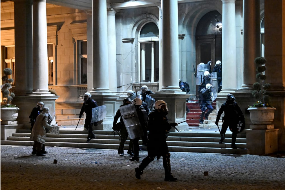
Jednotky pořádkové policie rozhánějí demonstranty u vchodu do budovy bělehradské městské rady

Organizace prostřednictvím své sítě 3 000 pozorovatelů zaznamenala rozsáhlé případy „duplicitních a nafouknutých volebních seznamů, hlasování bez osobních průkazů totožnosti, přítomnost neoprávněných třetích stran“ a další nesrovnalosti. Tvořili významnou část z více než 5 000 pozorovatelů, mezi něž patřily mezinárodní organizace, jako je OBSE a Evropský parlament, které rovněž vyjádřily znepokojení nad velkou rolí prezidenta při řízení demokratického procesu a znepokojujícími praktikami ve volebních místnostech.