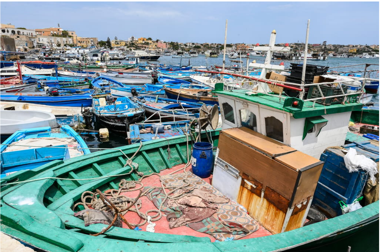
Čluny a nafukovací čluny používané migranty na Lampeduse

Rozhodující faktor: Zda si úředníci myslí, že migrant má šanci na přijetí, nebo ne. Ti, u kterých je nepravděpodobné, že by získali ochranu, by pravděpodobně zamířili přísnější cestou. Cílem by bylo vyřídit každou žádost na hranicích do 12 týdnů.