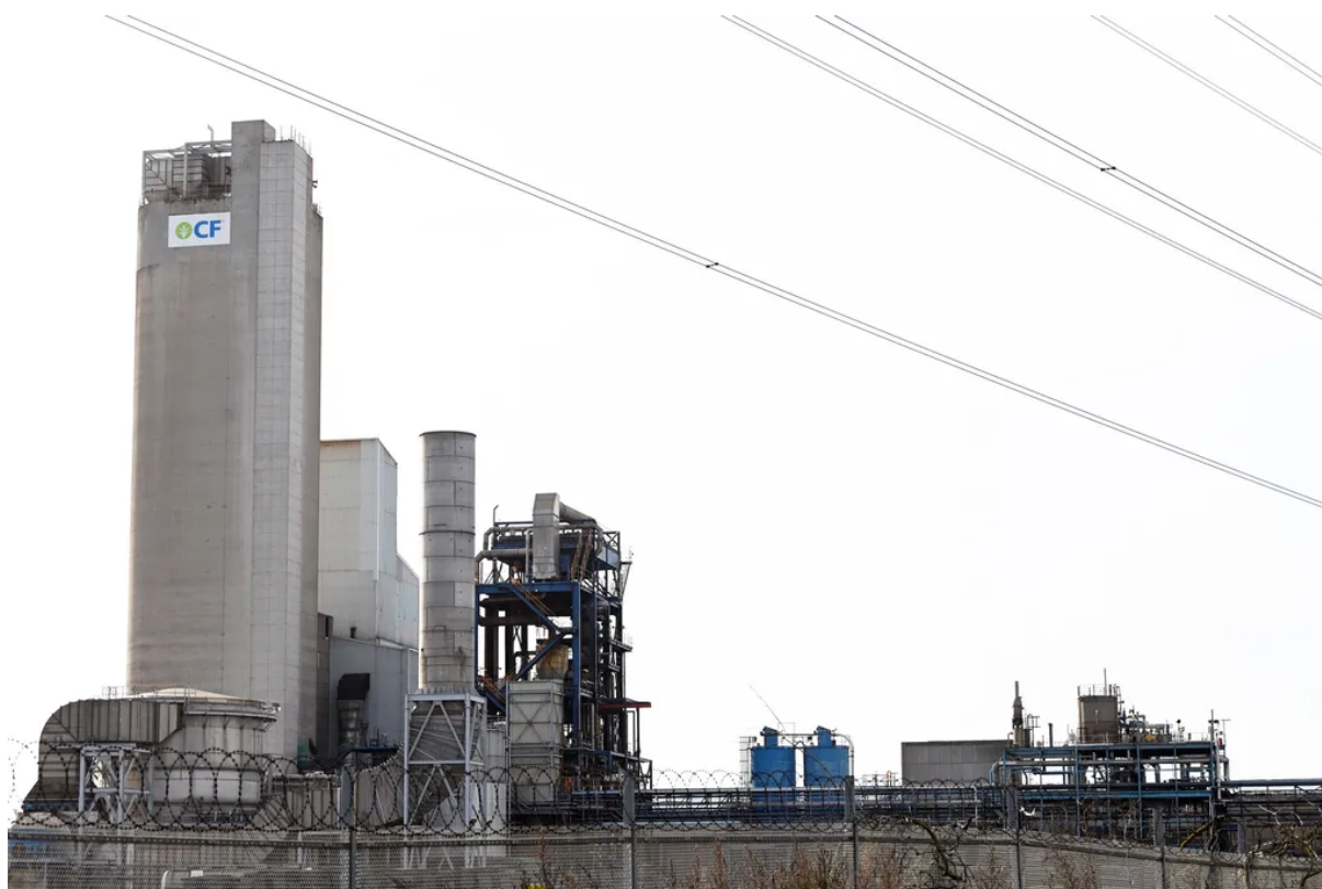
CF Industries již v červnu uzavřela svůj sesterský závod v Cheshire | Paul Ellis/AFP přes Getty Images

„Od loňského podzimu se odolnost trhu s CO 2 zlepšila díky dalším dovozům, další produkci ze stávajících domácích zdrojů a lepším zásobám,“ dodal mluvčí vlády.