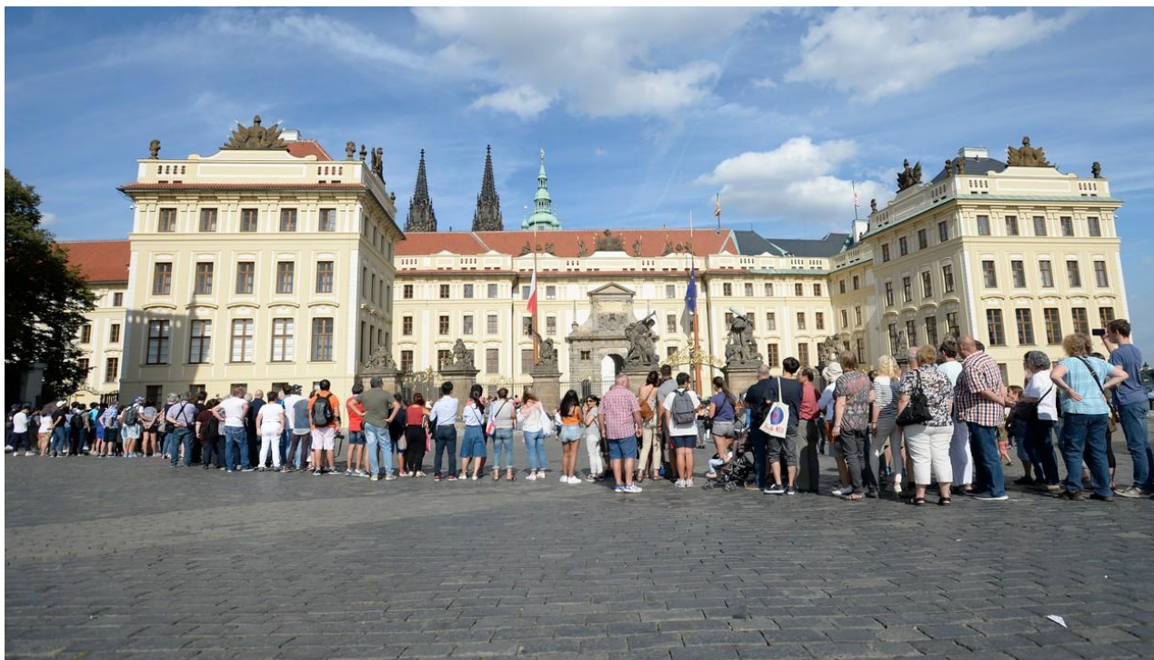
Pražský hrad