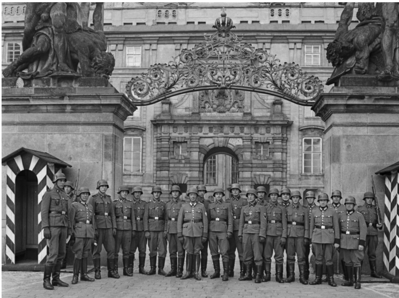
SS na Pražském hradě, 21. srpna 1942