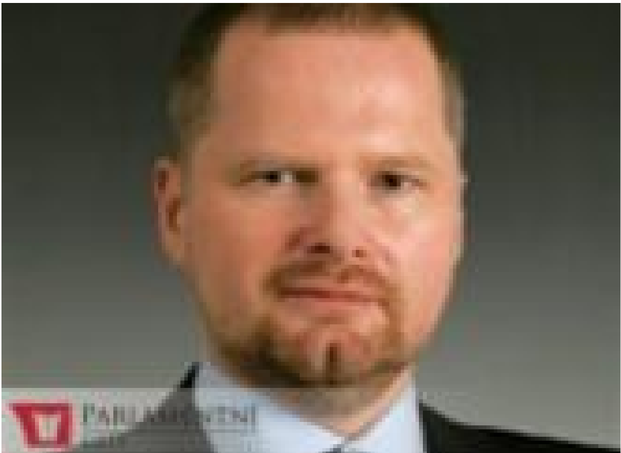
Prof. PhDr. Petr Fiala, Ph.D., LL.M.

prosazování zájmů globálních korporací na úkor občanů. Když si někdo za covidu dovolil kritizovat nesmyslná protiepidemická opatření, roušky, testy, vakcíny... snažil se lidi uklidnit, inspirovat k aktivní péči o zdraví, byl obratem označen za antiwaxera, dezinformátora, vraha seniorů. Když si dnes někdo dovolí zmínit naléhavost mírového řešení války na Ukrajině, je označen za dezoláta, chcmíra, vraha ukrajinských dětí. Vyžadován je jediný správný názor (na to dohlédne Ministerstvo pravdy – Pramini), bezpodmínečná nenávisť vůči Rusku (na to dohlédne Ministerstvo lásky – Lamini), podpora války (na to dohlédne Ministerstvo míru – Mirmini).