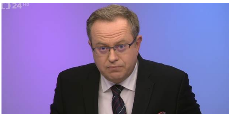
Popisek: Václav Moravec

Od hostů chtěl moderátor slyšet , zda je Česko připraveno na další možnou migrační vlnu spojenou s válkou v Izraeli, kterou v sobotu 7. října rozpoutalo palestinské hnutí Hamás. V EU v několika městech