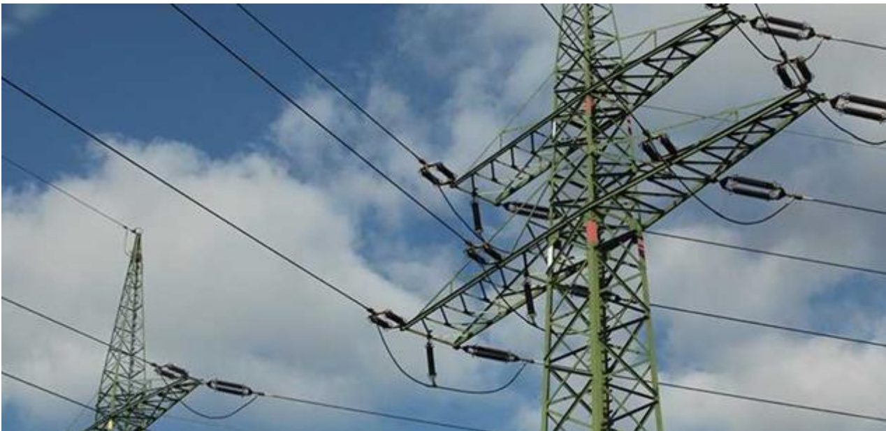
Popisek: Stožáry vysokého napětí