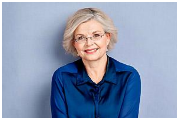
JUDr. Daniela Kovářová, senátorka ČR

Jako nezávislá kandidátka to neměla v žádném případě snadné, přesto JUDr. Daniela Kovářová uspěla. Rodinná advokátka a spisovatelka ze Štěnovic, bývalá ministryně spravedlnosti České republiky, charakteristická svou kšiltovkou, otevřeností a přirozeným vystupováním i názory. Gratulujeme!