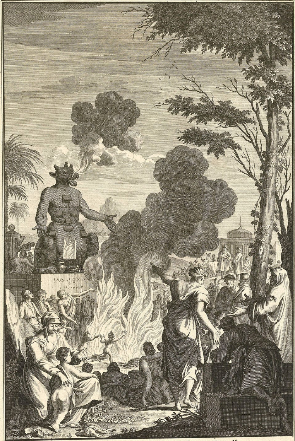
De Afgodt Moloch, met seven Hoken of Kapellen.