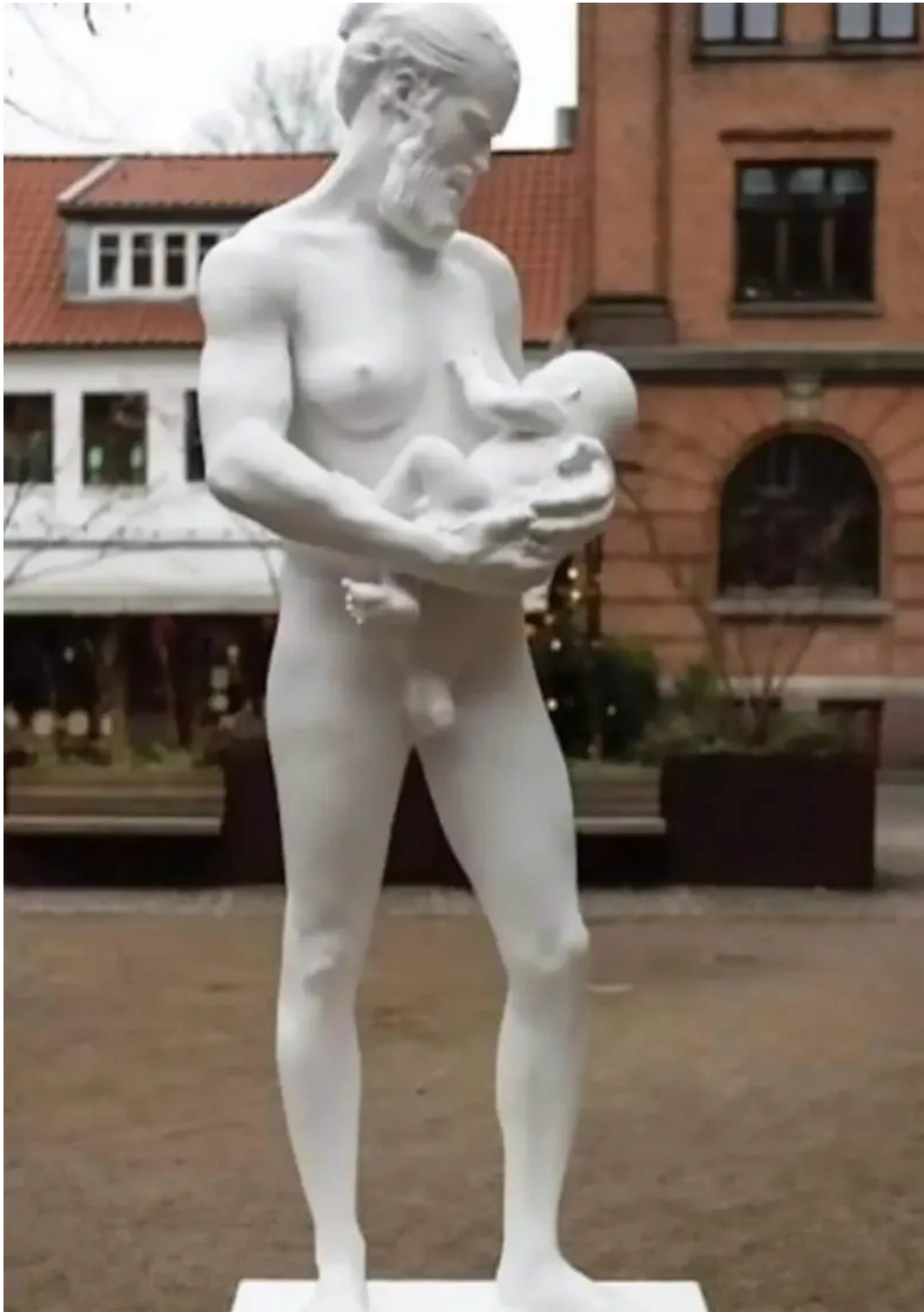
Socha na obrázku nahoře byla vyrobena pro Gender Museum v Dánsku.