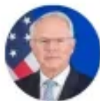
Christopher R. Hill