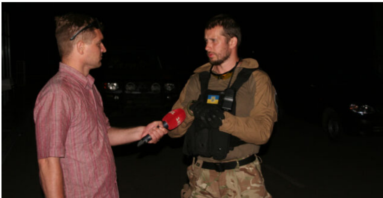
Andrij Biletski, rozhovor pro ukrajinskou televizi

V době svého vzniku byl prapor Azov ovládán především radikálními nacionalisty a národními socialisty. První velitel praporu, Andrij Biletski, byl také spoluzakladatelem etnonacionalistické strany Social Nationalist Assembly, jejímž deklarovaným cílem je vytvořit na Ukrajině „sociálně nacionalistický“ stát, zastavit imigraci a zajistit evropskou identitu Ukrajiny.