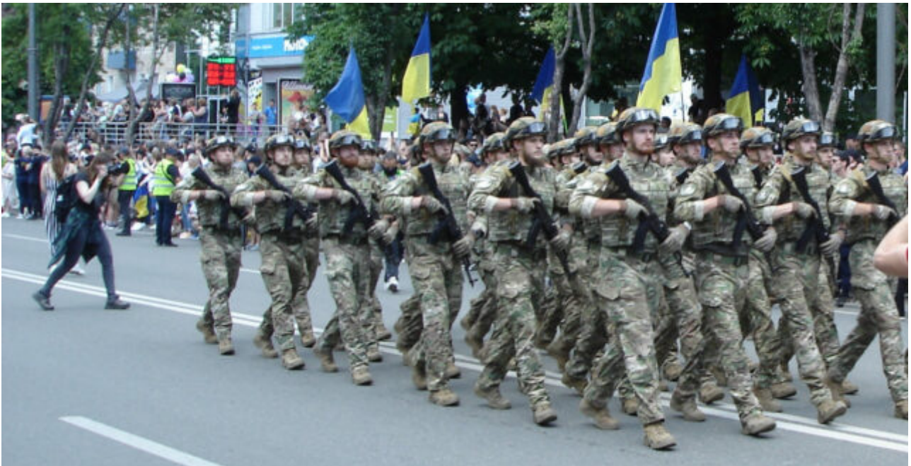
Vojáci z Azova se účastní přehlídky v Mariupolu

Kolik přesně zdrojů investovaly Spojené státy do výcviku a vyzbrojení praporu Azov, je těžké určit, částečně proto, že výcvik probíhal v tajnosti bez možnosti kontroly, ale také proto, že nejde o jedinou ukrajinskou polovojeenskou jednotku, která získala podporu USA. .