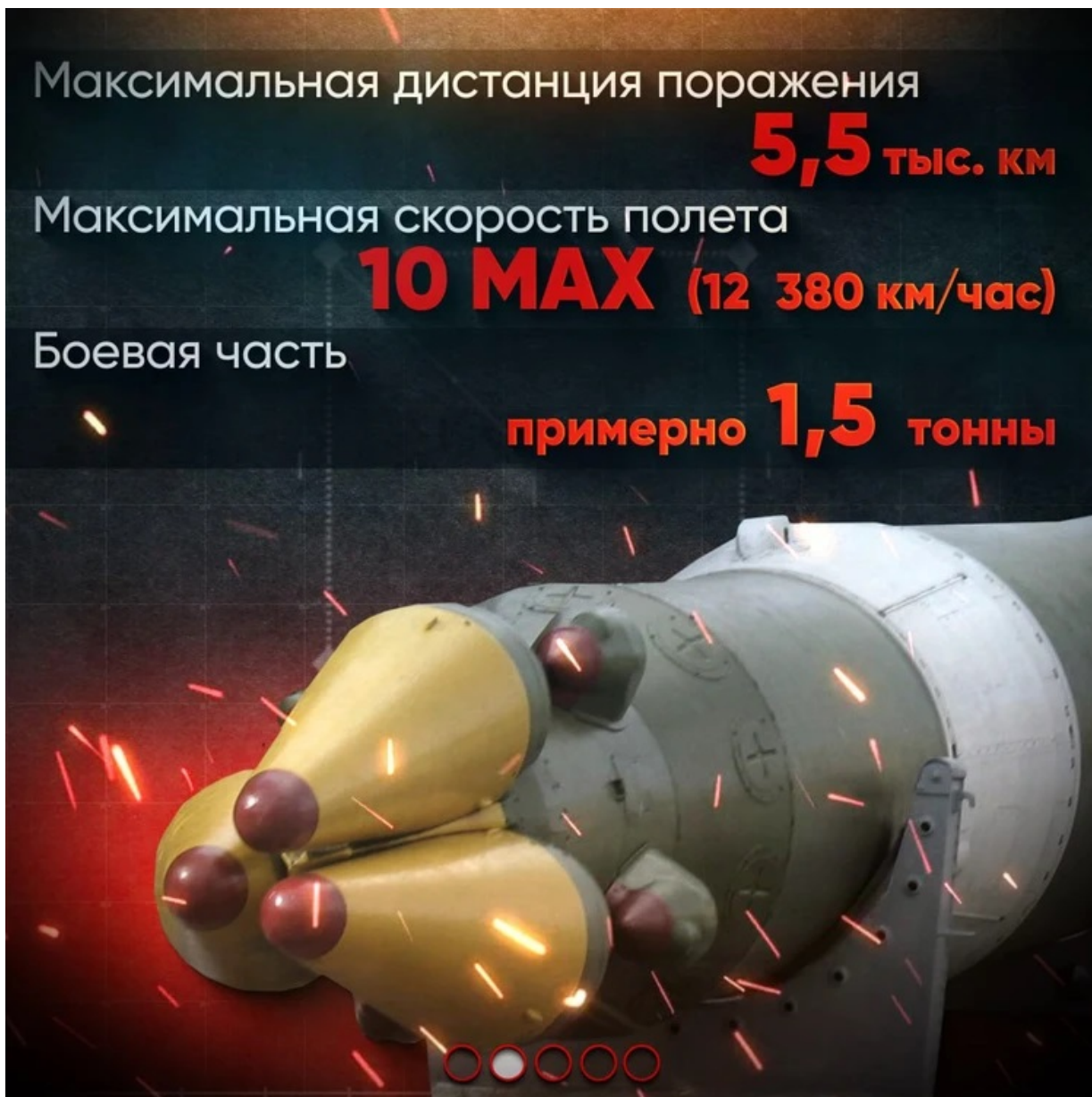
Orešnik: Včera zveřejněná ruská grafika 1

Síla úderu jediné hlavice = 45 Hirošim. Raketa nese 2 jaderné hlavice a nejméně 4 nejaderné hlavice, které primárně slouží k “přetížení a zmatení” nepřátelské protiraketové obrany. Všechny hlavice po oddělení od nosné rakety samostatně manévrují a řítí se na cíle rychlostí 12 380 km/h, (10 Mach, 3 km/s). Úder jednoho Orešnika má sílu 90 Hirošim, (2 hlavice po 45 Hirošim). Jeden Orešnik, při “pozemním úderu” tak kompletně vymaže celou Prahu nebo Berlín z povrchu planety, se všemi obyvateli, bez ohledu na to, zda se ukryjí v metru, nebo ne. Přežít mohou pouze některé elity “ve specializovaných vládních hlubokých a rozptýlených úkrytech.” Síla