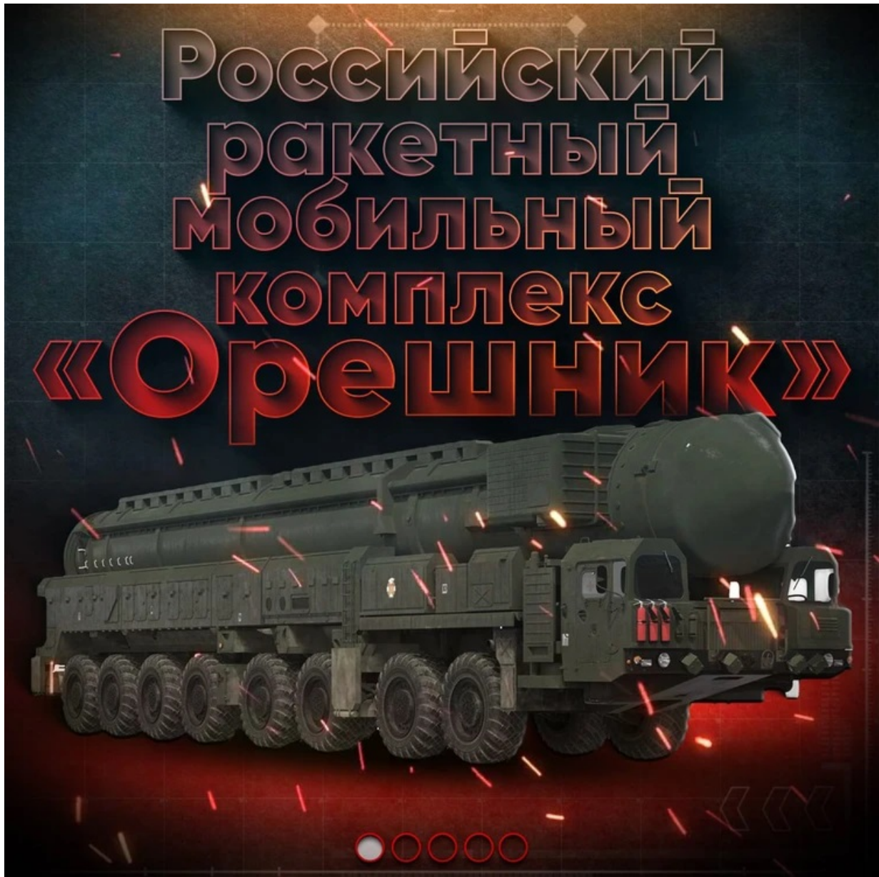
Orešnik: Včera zveřejněná ruská grafika 2

2 hlavic Orešnika představuje 1.8 megatuny TNT. 30 raket Orešnik představuje ekvivalent nejsilnější bomby lidstva – CAR – 50 megatun , která byla pokusně svržena na Novou Zemi.