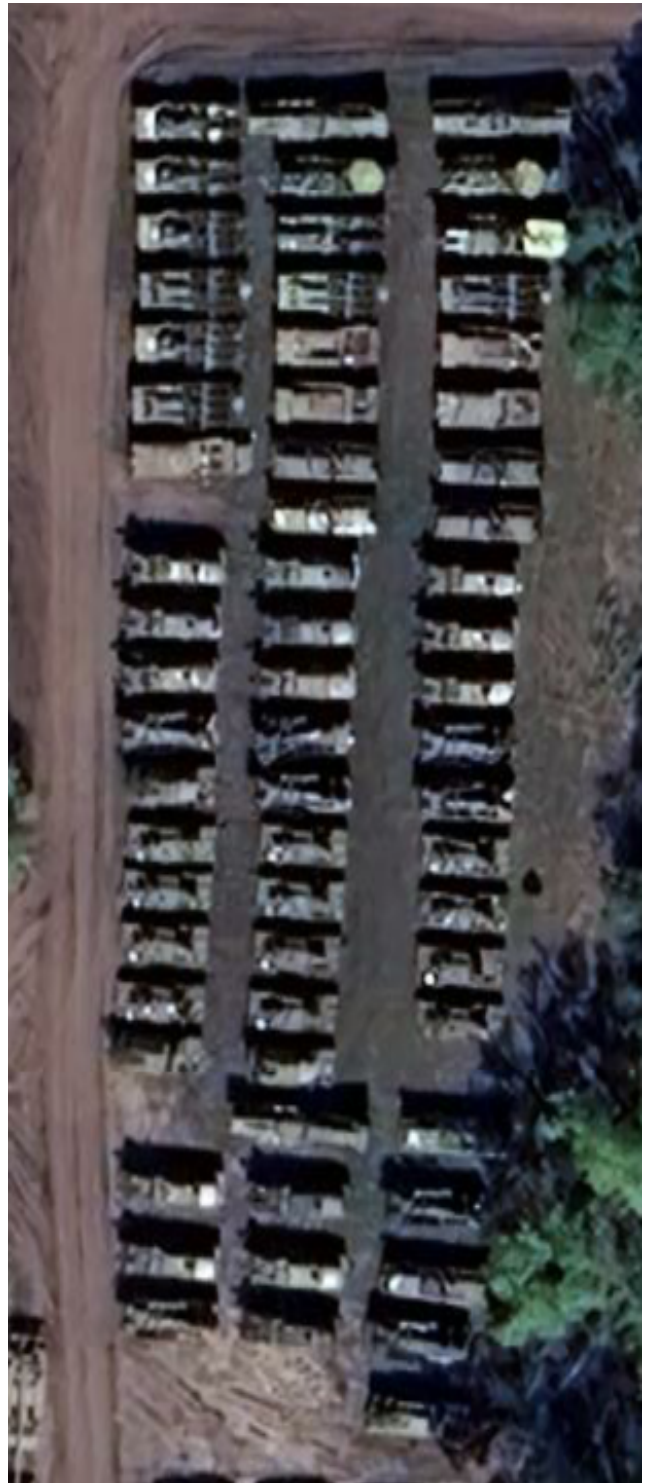
Satelitní snímek skladu S-300, TOR, a Tunguska. Sklad je na souřadnicích 55°00'54.0"N 73°23'39.7"E ve městě Omsk.

důsledku kyjevské operace ATO, zastavená od roku 2017 . Jediná Gosudarem v červenci nově opravená pec číslo 5 vyprodukuje 1 milion tun oceli ročně, tedy 28% bývalé roční produkce ostravské huti Liberty , kterou nechala letos česká vláda zkrachovat. Celkem Putin plánuje na Donbase brzy obnovit 93 000 pracovních míst v hutním a strojírenském průmyslu.