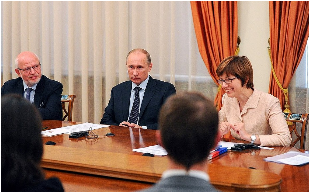
Vladimír Putin a jeho globální finanční čarodějka Ksenia Judajevová při jednání s G-20.

obnovuje spolupráci s Ruskem, která byla v roce 2022 sankcemi přerušena, a vysoká delegace MMF bude ve dnech 16. září až 1. října vést rozhovory v Moskvě.