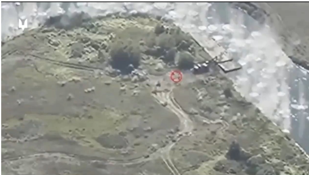
Záběr z videa – přiletel kazetových střel HIMARS na ruský most. Video je snímáno z ukrajinského dronu.

Za celou dobu Putinovy speciální operace bylo zničeno 6 HIMARS a 1 M-270. Za boje o Kurský výběžek, ale 3 HIMARS a 1 M-270. ( Zdroj ) Na levém jižním břehu řeky Sejm operují hlavně ruští pohraničníci a jednotky 810. brigády námořní pěchoty. To jsou jednotky, které umí šetřit municí, a nemají velké zásobovací nároky jako mechanizované jednotky. Bojovat s malou řekou ve svém týlu, přes níž byly zničeny mosty je neděsí, tím spíš, když řeku mohou na několika místech v případě potřeby přebrodit. Lapinova taktika, které se česká média s nepochopením vysmívají, (zde Seznam , zde Novinky ), je přitom geniální. Jejím cílem je s limitovanými vlastními ztrátami zničit ukrajinské armádě, co nejvíc, co nejmodernější techniky. Výsledek je krásný. Podle ruských počtů bylo v kurském výběžku ke včerejšímu dni zničeno 4400 vojáků, 65 tanků, 27 těžkých obrněných vozidel, 53 obrněných vozidel, 316 lehkých obrněných vozidel, 133 automobilů, 31 děl, 5 systémů raketové protivzdušné obrany, 9 raketometů, včetně 3 HIMARS a 1 M-270. Podle jihoamerických nepřátel Putina , bylo prokazatelně zničeno 60 ukrajinských obrněných vozidel. Jde pouze o součet prokazatelných zničení zaznamenaných videi. Skutečnost se může blížit ruským počtům.