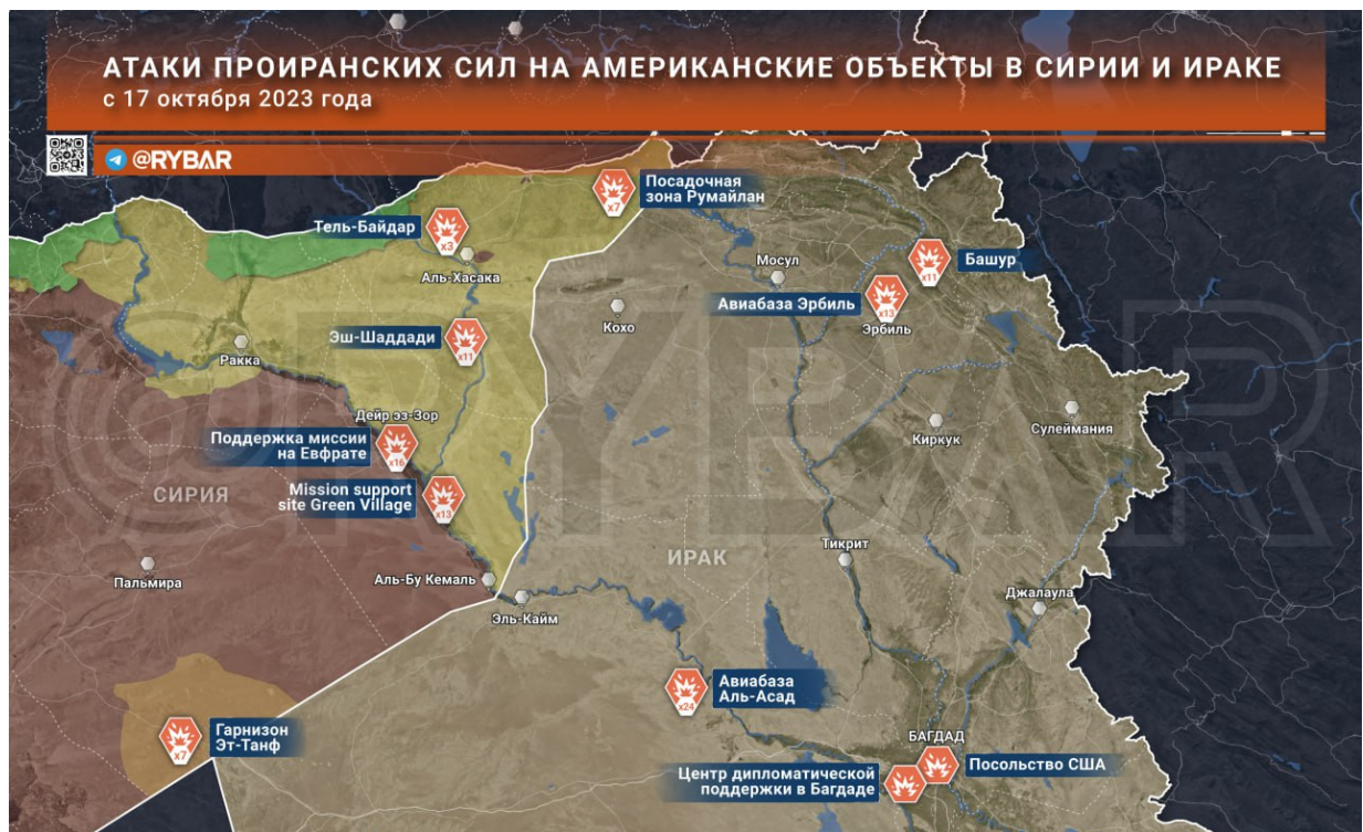
Mapa 108 útoků drony a raketami proti USA!

Logika Putina, kterého stravují emoce, je pro analytiky CIA takřka nemožné si představit. To je naprostá změna chování! Pokud ji Putin, který chladnokrevně myslí na celá léta dopředu, najednou veřejně publikuje své rozhořčené emoce, je to svým způsobem umocněný chladnokrevný vzkaz USA, a dalším zbrojřům Ukrajiny – Pozor!!! Mohl bych se naštvat!!!