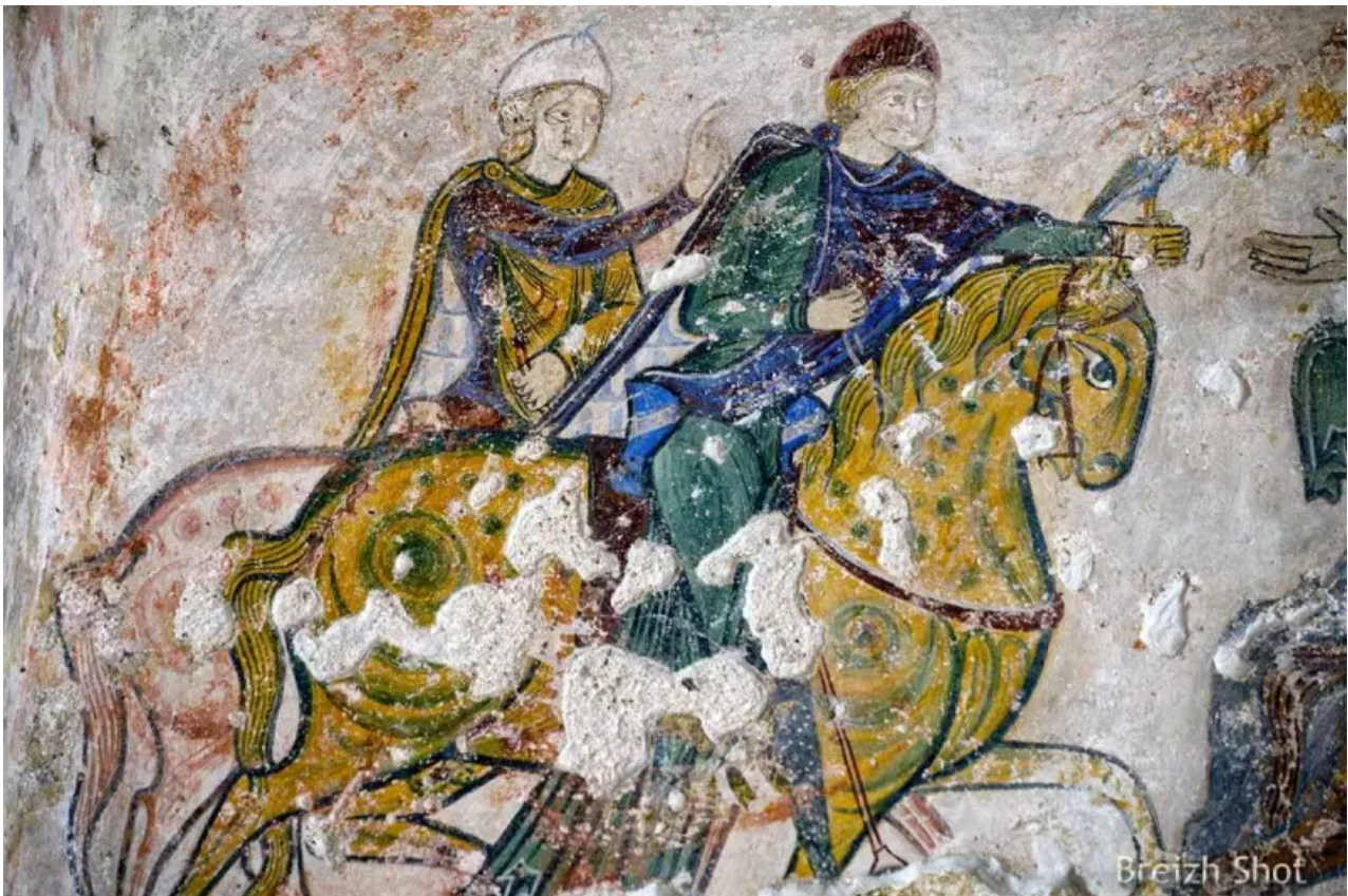
Eleonora a Jindřich II., freska kaple Saint Radegonde, Chinon

A matkou bratrů byla Alienor, vévodkyně z Akvitánie a Gaskoňska, hraběnka de Poitiers, královna Francie (1137-1152) a Anglie (1154-1189), stejně jako dvorská láska. Byla pravnučkou Viléma IX. Akvitánského, který je považován za zakladatele žánru minnesanga („milostné písně“), vnučkou a dcerou trubadúrských vévodů.