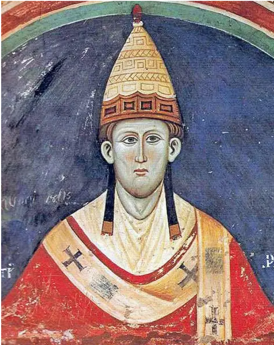
Innocent III na fresce kláštera Sacro Speco, kolem roku 1209

Příčinou konfliktu bylo Johnovo neuznání pravomocí Stephena Langtona, kterého tento pontifik jmenoval arcibiskupem z Canterbury. V roce 1208 Innocent uvalil na Anglii interdikt, ale Jan hrozil mučením a dokonce popravou a zakázal kněžím poslouchat papeže. A pak poslal své úředníky vybírat příjmy z církevních pozemků. V roce 1209 byl král exkomunikován z církve.