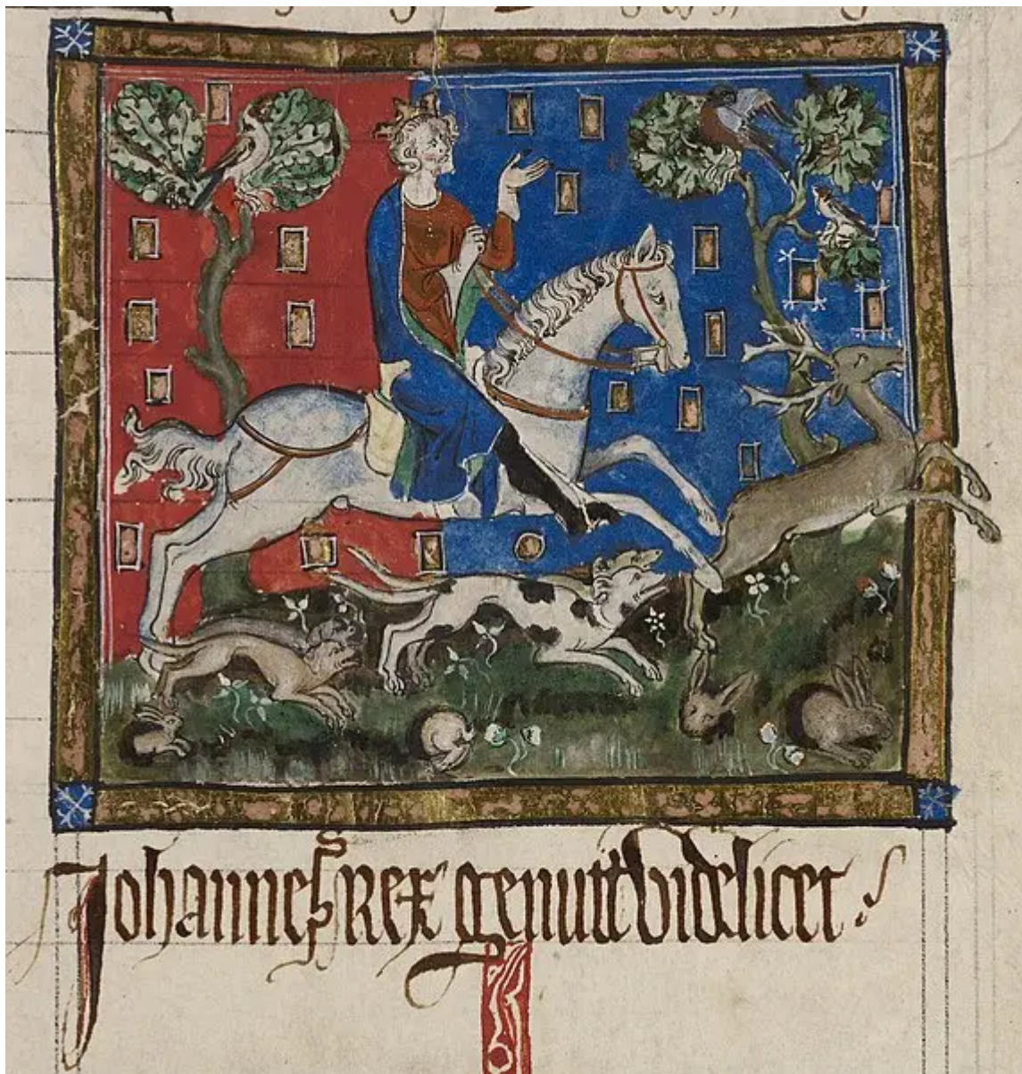
Král Jan na lovu, miniatura ze 14. století

John byl pátým synem Jindřicha a Eleonory (porodila ho v roce 1167 ve věku 46 let) a jeho oblíbeným synem. Otec mu okamžitě daroval mnoho pozemků v Anglii a v roce 1177 mu daroval celé Irsko. Anglie a zejména Irsko však v té době byly skutečnými dvorky civilizovaného světa. A země v Normandii a další francouzské majetky Plantagenetů již byly rozděleny mezi nejstarší syny Jindřicha, a proto ho milující otec, který považoval svého nejmladšího syna za zbaveného, nazval „bezzemkem“ – Lackland (jiné verze této přezdívky – Johannes Sine Terra – latina, Johan sans Terre – francouzština). Po dlouhou dobu tato přezdívka nebyla