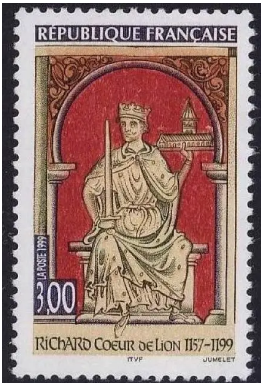
Richard I. na francouzské poštovní známce