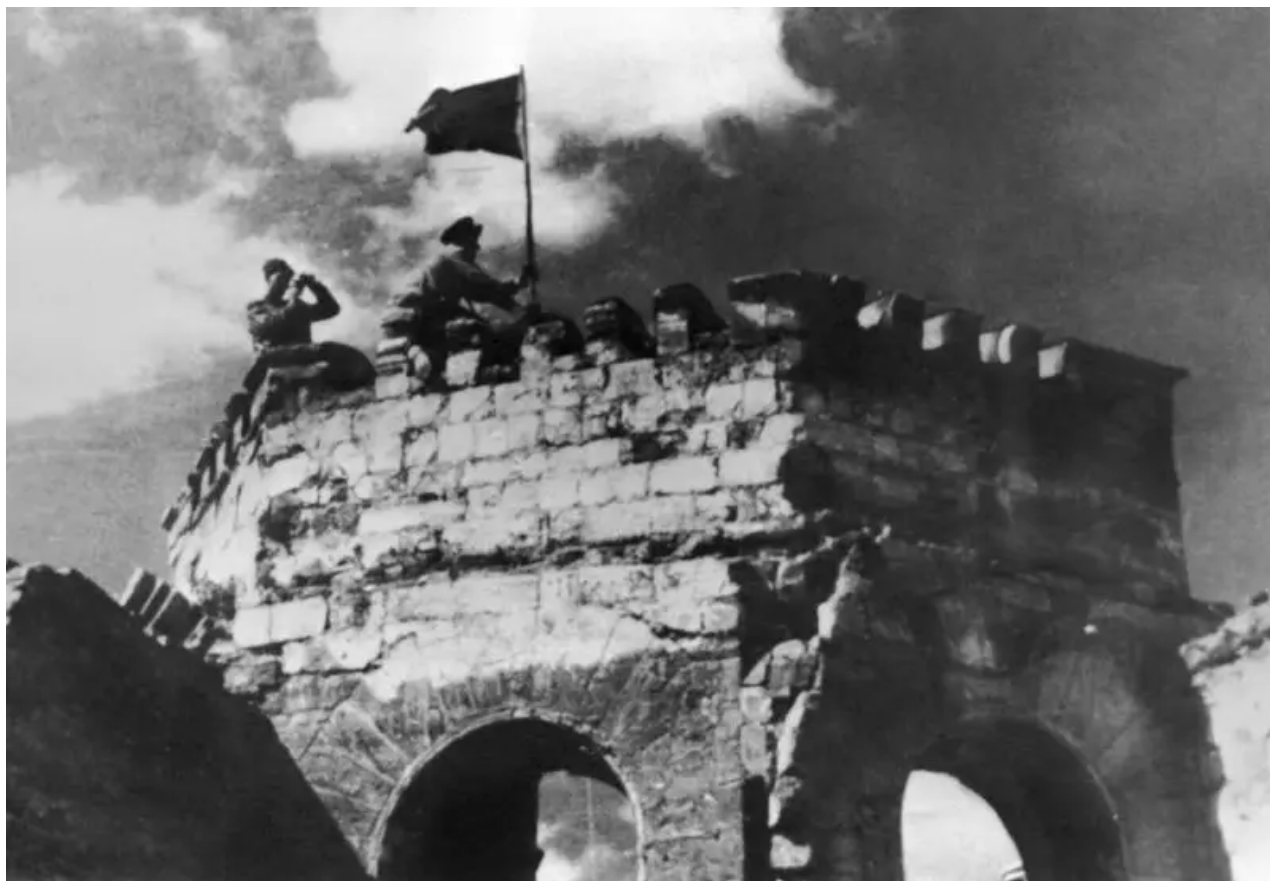
Vojáci Rudé armády vyvěšují Rudý prapor nad budovou městské rady v Kišiněvě