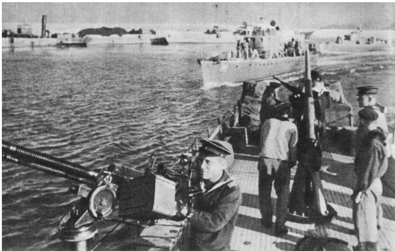
Sovětské čluny Černomořské flotily typu MO-4 vplouvají do přístavu Varna. září 1944

A Türkiye byla znepokojena. Zachovala neutralitu, ale byla přátelská k Německu a čekala na křídlech, kdy bude moci profitovat na úkor Ruska. Nyní by se dalo zaplatit za přípravu invaze na Kavkaz. Turci začali naléhavě navazovat přátelství s Brity a Američany.