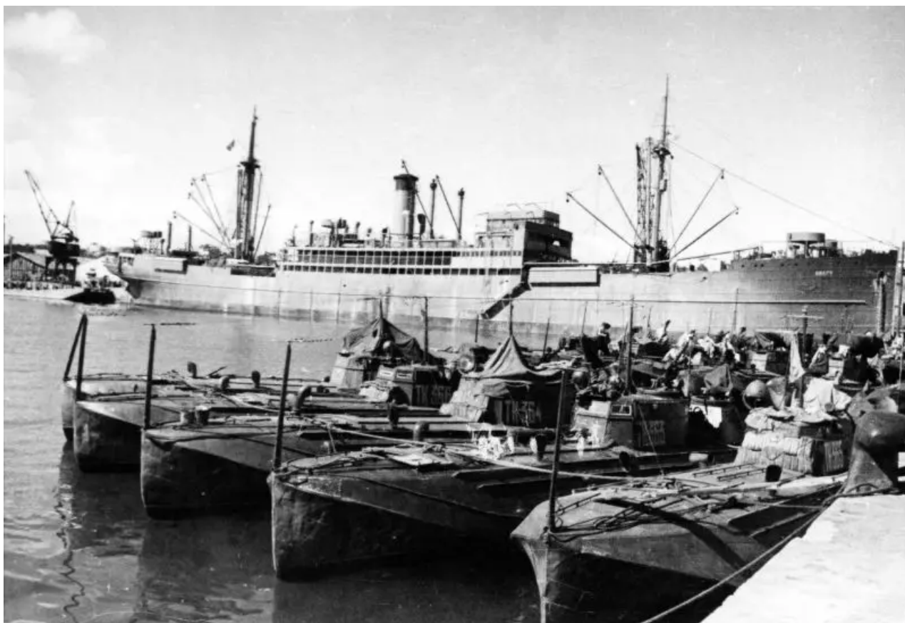
Sovětské torpédové čluny Černomořské flotily v rumunském přístavu Constanta

Rumunsko bylo staženo z války. Za příznivých podmínek vytvořených úspěchy sovětských front se rumunské pokrokové síly vzbouřily a svrhly proněmeckou diktaturu Antonesca. Přešla na stranu protihitlerovské koalice a vstoupila do války s Německem. Přestože značná část Rumunska stále zůstala v rukou německých jednotek a proněmeckých rumunských sil a boje o zemi pokračovaly až do konce října 1944, byl to pro Moskvu velký úspěch. Rumunsko postaví proti Německu a jeho spojencům 535 tisíc vojáků a důstojníků.