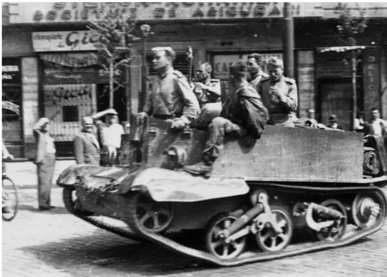
Sovětsí vojáci vjíždějící do Bukurešti v britském lehkém obrněném transportéru Bren Carrier.