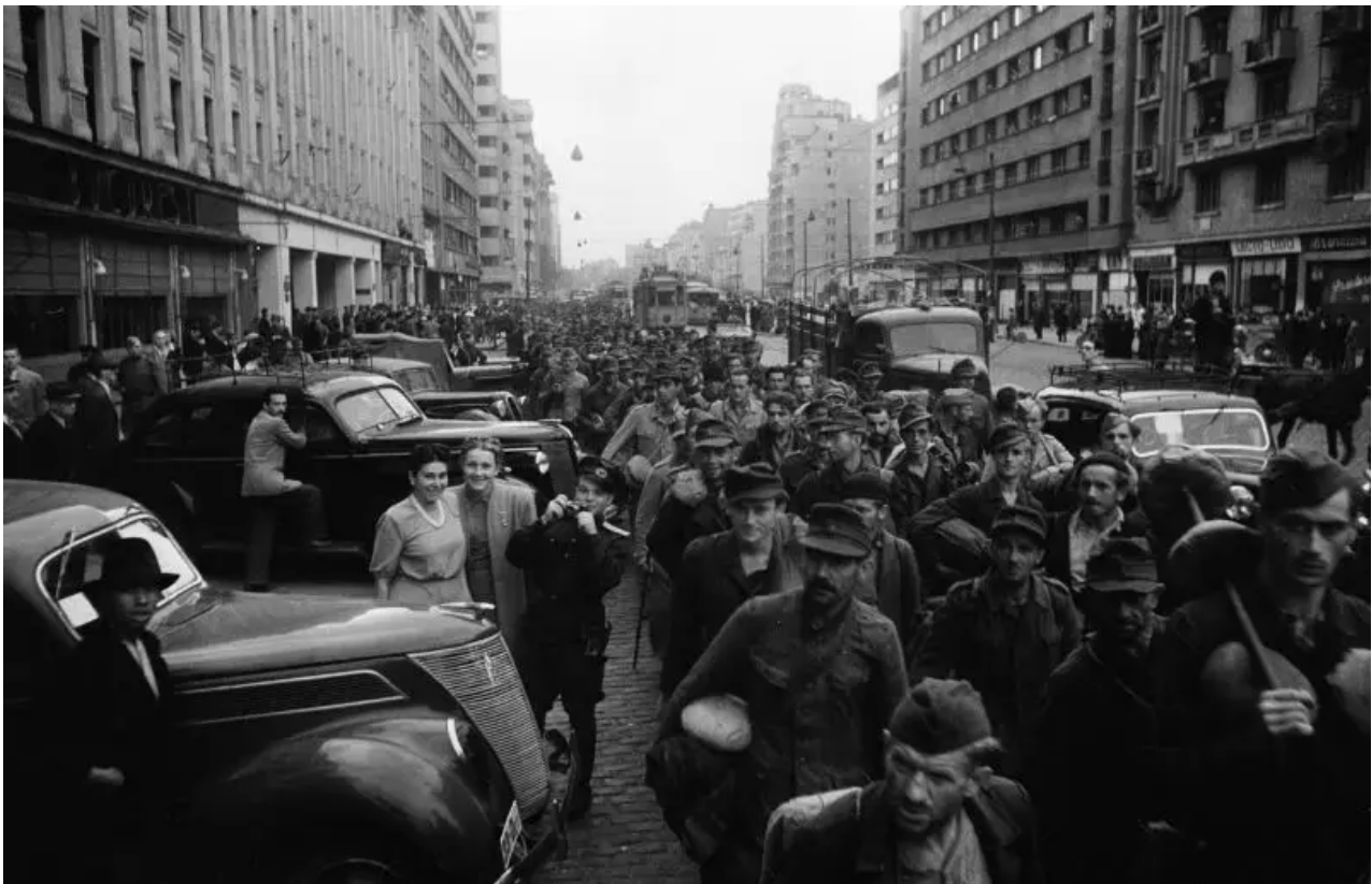
Sloup německých zajatců na ulici v Bukurešti

Sovětská ofenzíva mezitím pokračovala. 2. UV postupovalo směrem k severní Transylvánii a směrem na Focsani. 27. srpna sovětská vojska obsadila Focsani a dosáhla přístupů k Ploiesti a Bukurešti. Jednotky 46. armády 3. UV rozvinuly ofenzivu na obou březích Dunaje a odřízly poraženým německým jednotkám únikové cesty do Bukurešti. Černomořská flotila a Dunajská vojenská flotila asistovaly ofenzívě pozemních sil, vylodily taktické jednotky a rozdrtily nepřítele s pomocí letectví. 27. srpna bylo obsazeno Galati. 28. srpna sovětská vojska osvobodila města Braila a Sulina. 29. srpna obsadila výsadková síla Černomořské flotily přístav Constanta. Téhož dne dosáhl předsunutý oddíl 46. armády Bukurešti.