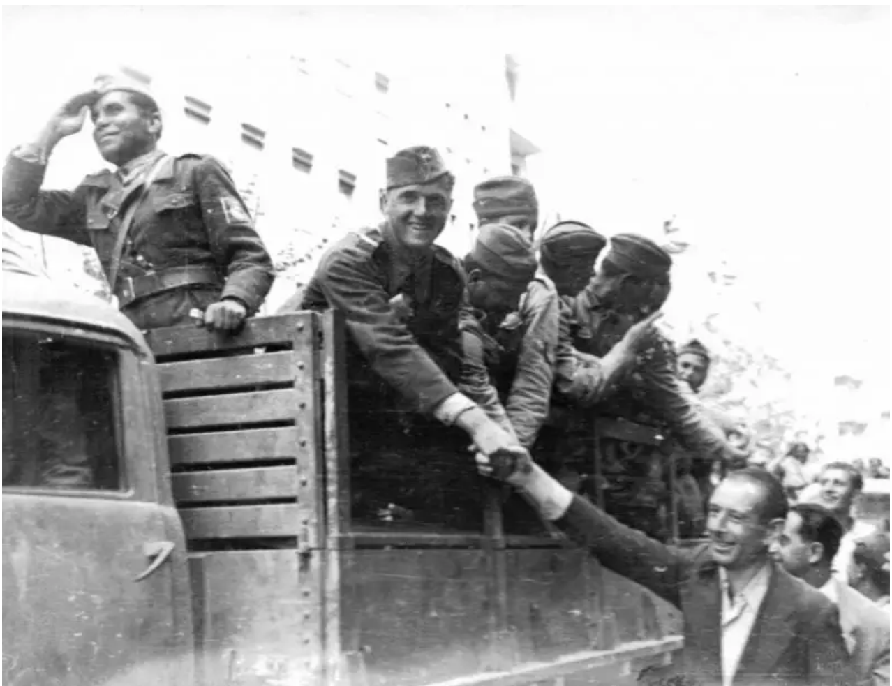
Rumunští vojáci sovětské divize pojmenované po Tudoru Vladimirescovi zdraví své krajany v ulicích osvobozené Bukurešti.

Ve stejné době se ruské jednotky přiblížily k Bukurešti ze směru od Ploesti a z východu. 31. srpna 1944 vstoupila sovětská vojska do Bukurešti. Tím byla dokončena operace Iasi-Kišiněv. Začaly operace k dokončení osvobození Rumunska a okupace Bulharska s přístupem k hranicím Jugoslávie.