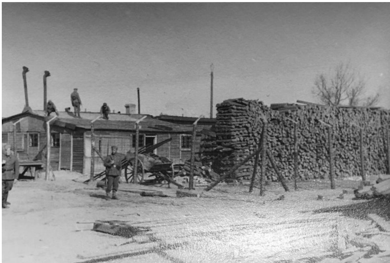
Tábor ve městě Ostrov, 1942