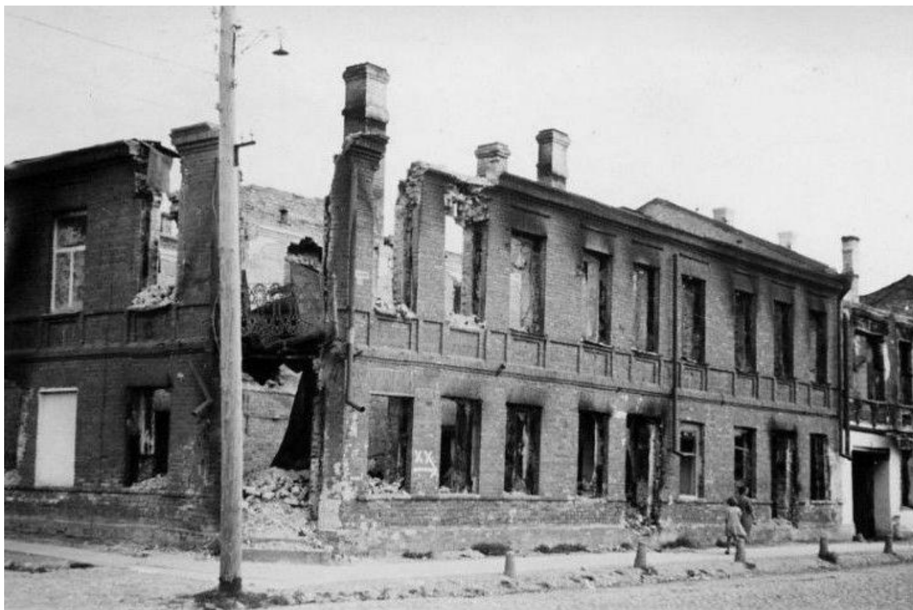
Město Ostrov po okupaci

“Když Němci odešli, vyhodili do povětří všechno, co se dalo vyhodit do povětří. Ostrovským rajónem vedla železnice z Pskova do Polotska. Bylo to celé rozebráno a vyhozeno do povětří. Když přijeli naši vojáci, už to prostě nezbylo. Mosty byly zničeny I já jsem se musel před několika lety zúčastnit odminování u Ostrova – pomoci odstranit nášlapné miny, které před odjezdem nastražili Němci. Tady na okraji Ostrova byly v a Pokud by vybuchly, nestalo by se, že by na ně nikdo nešlápl nebo je nepřešel, ležely mělce zakryté, připravené k detonaci,“ říká Pyotr Grinchuk, ředitel oddělení. Vojenské historické muzeum-rezervace regionu Pskov.