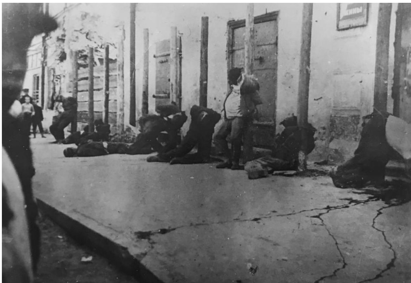
Poprava deseti partyzánů v Pskově, srpen 1941

Máme fotografie této poprav, které byly později nalezeny u německého důstojníka zajatého u Rigy, na zadní straně bylo napsáno: „Poprava deseti partyzánů v Pskově. . srpna 1941.“ Docházelo k dalším hromadným popravám, provádělo se cílené vyhlazování obyvatelstva. Byl nastolen brutální okupační režim,” říká herectví. Ředitelka Státního archivu Pskovské oblasti Natalya Isakova.